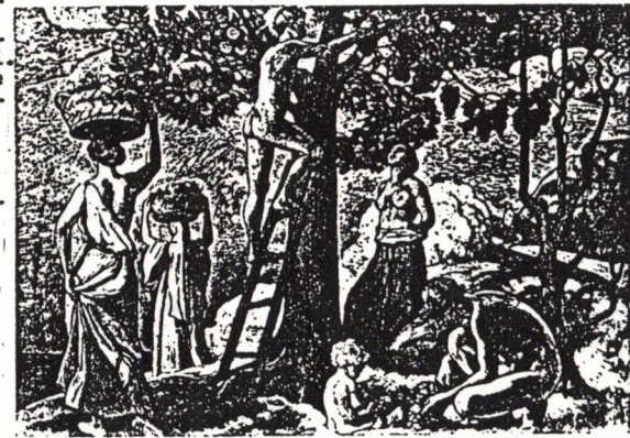
Ludivig von Hofmann: Sběr vlna (1906) Z uměleckých sbírek ve Výmaru