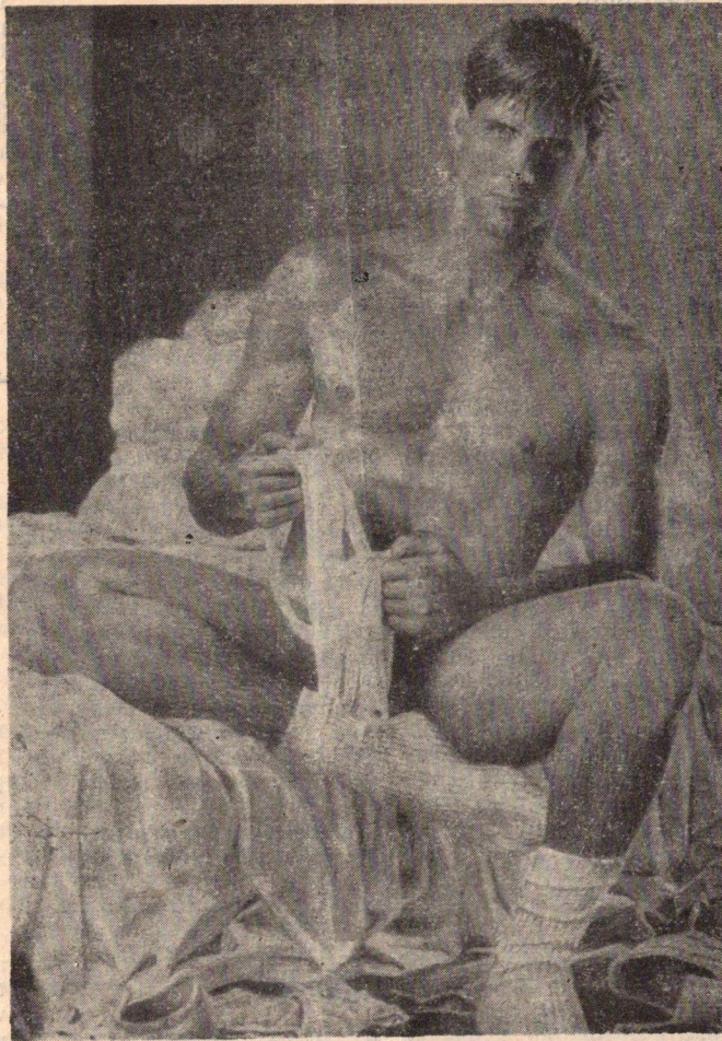
Sakral Ten sex s inzerenty Lambdy je náročná věc. Pořád se solíkat, voblíkat...

všechno nechá tak, jen aby se vyhnul hanbě.“