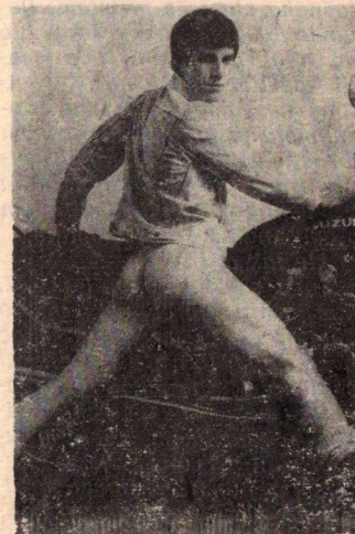
Tak kam se teď vydat? Do Prahy, Brna či Mostu? Anebo do Velkého Krtíše za tím jedním?

15. 12. 1990 — vyšlo poslední (9.) číslo LAMBDA, prvního oficiálního měsíčníku homosexuálních občanů v ČSFR.