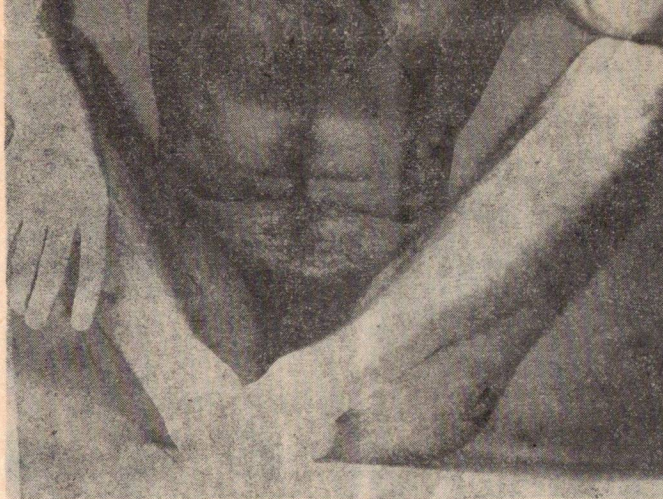
Po přečtení Lambdy mám vždycky výbornou náladu. Dokonce ani masáž froté ručnicky nepotřebuji!