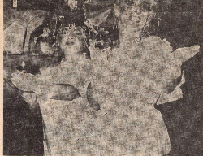
Tak pojďte, pojďte slavít Silvestra! Po přípitku Vám hned dáme přihlářku na Lambda revui, říkář oči členek Lady Peachford.

Sledujte v novinách Annonce cí. Sledujte pozorně Annonce! rubriku 28 — 1 „Skupiny, Dobřrý tip i pro venkovské or- spolky a termíny“. První zá- kladní organizace Svazu Lam- bda v Praze zde bude uve- řejňovat termíny a místa ak- (sb)