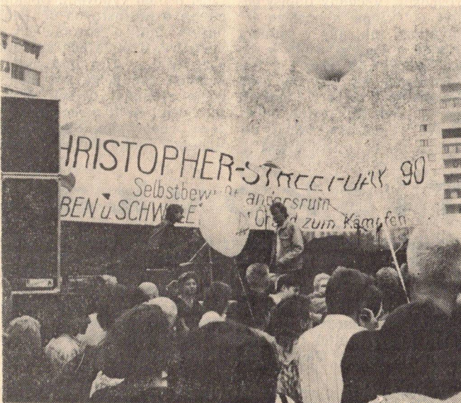
O Christopher Street Day jsme vás již podrobně informovali. Tentokrát přinášíme snímek z manifestace.

Ti, kteří vyvinuli veliké úsilí pro získání této velice pěkné kavárny pro klubové večery jihomoravské oblastní organizace, se museli za své členy nejen stydět. Odcházelí tentokrát i s pocitý hořkosti. (luk)