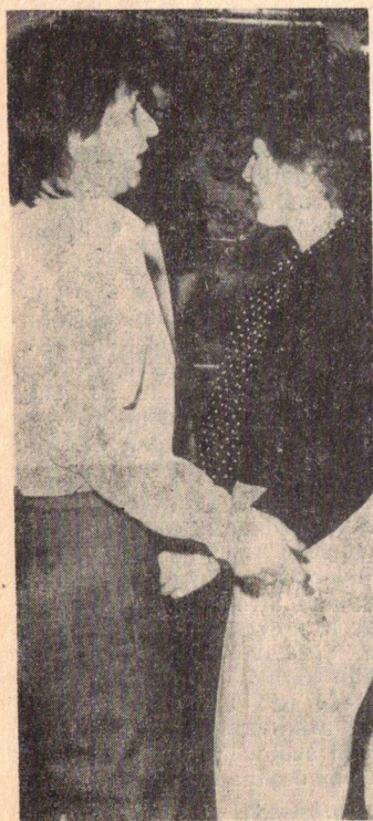
Míjíme Barrandov, Zbraslav... a je nám na vltavské vodě dobře. Kéž by se tyto chvíle opakovaly častěji.